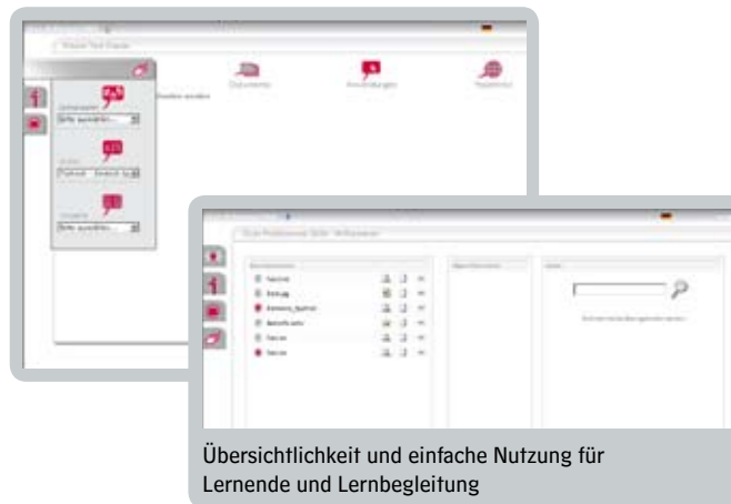
Übersichtlichkeit und einfache Nutzung für Lernende und Lernbegleitung

Mit der Lernplattform IQ:on können ganz persönliche Lernmenüs aus Lernsoftware, Hyperlinks, Materialien und Multimediadateien zusammengestellt werden. Diese Lernmenüs lassen sich – je nach Inhalt, Umfang und Dauer – in Projekten, Kursen oder Lerngruppen zusammenfassen. Thematisch kann alles das eingebunden werden, was als Lernsoftware angeboten oder vom Lernzentrumspersonal selbst erstellt wird.